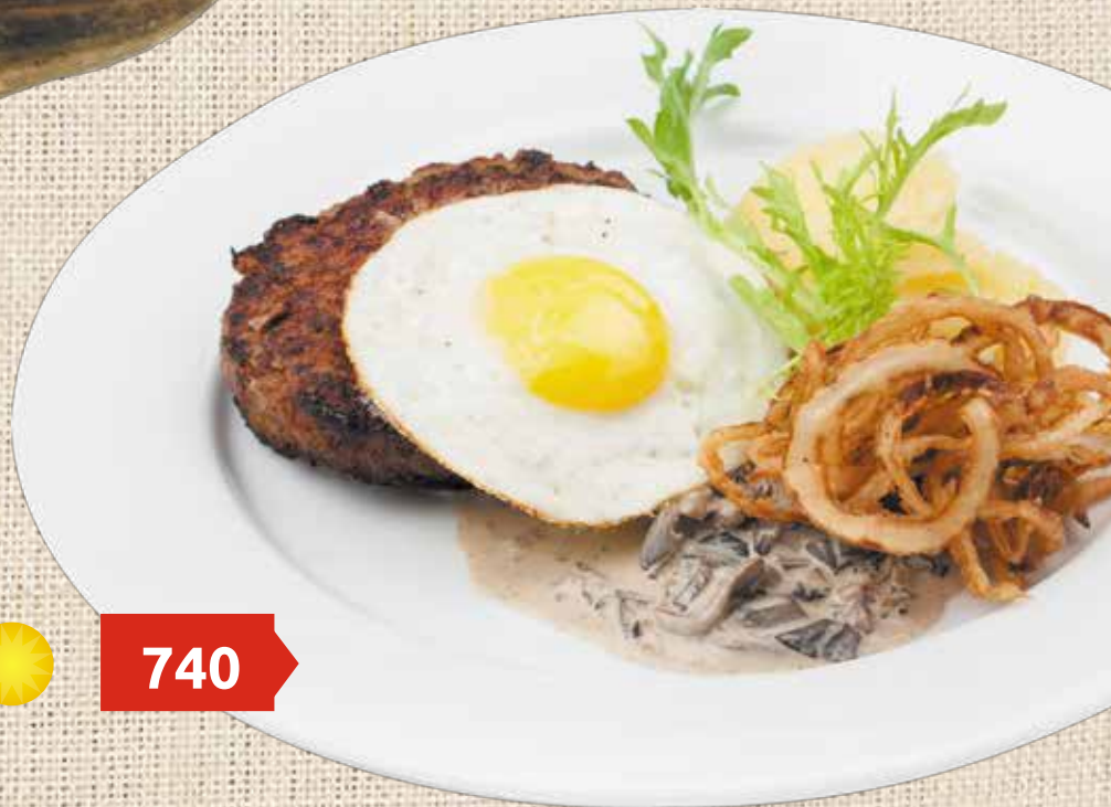
РУБЛЕННЫЙ БИФСТЕКС ИЗ ТЕЛЯТИНЫ (1/200/100/50/40/30).....740 (подаётся с картофельным пюре, грибным соусом, луком фри и жареным яйцом)