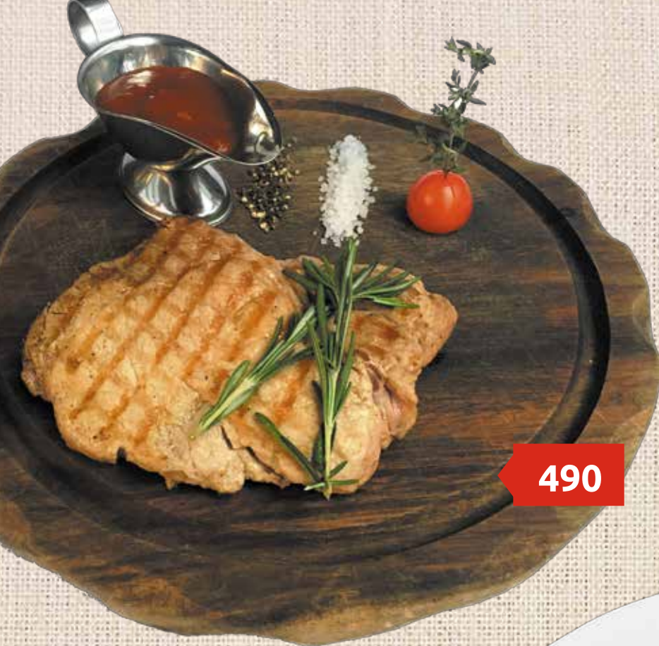
СВИНОЙ СТЕЙК ИЗ ШЕЙНОЙ ЧАСТИ (1/220/70/20).....490 (подаётся с соусом BBQ и черри томатом, дробленным черным перцем и морской солью)